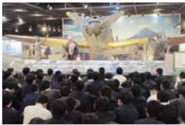
語り部による講話の様子